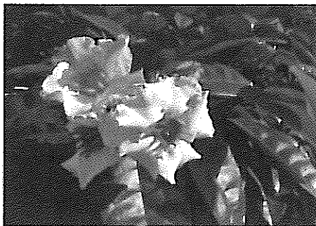
Abb.: Strophanthus-gratus -Blüte

SL: Bis in die 1990er Jahre hatte jeder Notarzt mehrere Ampullen Strophanthin-Lösung in seinem Arztkoffer. Strophanthin war über Jahrzehnte dasjenige Mittel, welches einem Herzinfarktpatienten als erstes Mittel verabreicht wurde. Von 1890 bis in die 1960er Jahre war, wie Sie sagen, Strophanthin das Mittel der Wahl bei der Behandlung und der Prophylaxe dessen, was in der Öffentlichkeit als Herzschwäche und als Herzinfarkt bezeichnet wird. Warum wurde spätestens seit den 1970er Jahren Strophanthin aus der Therapie nach und nach verdrängt?